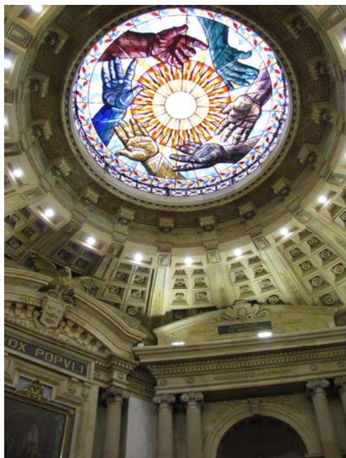
Cúpula del Senado colombiano.

El Congreso “Hacia una agenda legislativa para el desarrollo con perspectiva de género para las Américas” se realizó los días 20 y 21 de noviembre de 2008 en la sede del Senado de la República de Colombia en Bogotá. En la oportunidad participaron 37 parlamentarias y parlamentarios provenientes de Bolivia, Brasil, Canadá, Colombia, Costa Rica, Cuba, Dominica, Haití, Granada, Guatemala, Jamaica, México, Perú, República Dominicana y Santa Lucía. El congreso fue co-organizado por el FIPA y la Fundación Agenda Colombia.