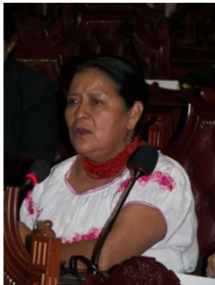
La diputada Otilia Lux, de Guatemala.