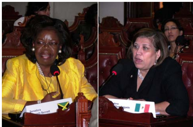
La senadora Hyacinth Bennett, de Jamaica, y la senadora mexicana Judith Díaz.

Se planteó, entre otras cuestiones, la necesidad de enfocarse hacia el sector de las mujeres indígenas, mediante capacitación y apoyo al desarrollo de nueva legislación. Se notó en este sentido el potencial del banco de datos de legislación indígena del BID como instrumento de seguimiento. Se enfatizó asimismo el papel de los medios de comunicación y su función social en la eliminación de los estereotipos difundidos sobre la mujer. Una vez más, la necesidad de una mayor colaboración entre hombre y mujeres fue destacada.