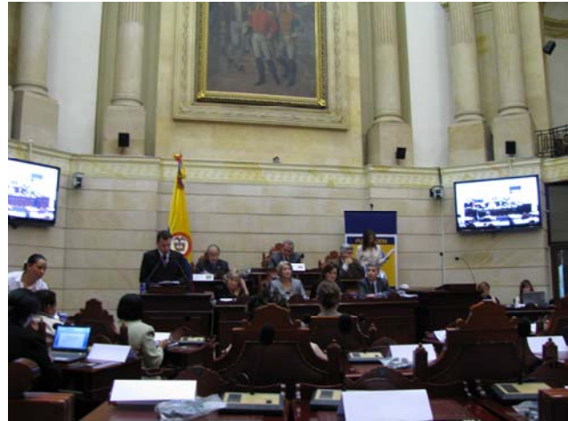
Ceremonia de apertura.

Se refirió en este sentido al compromiso asumido por los Estados alrededor de los Objetivos de Desarrollo del Milenio, recordando que si bien el objetivo tres (3) propone específicamente promover la equidad de género y la autonomía de la mujer, todos los objetivos están relacionados con aspectos esenciales del bienestar de las mujeres.