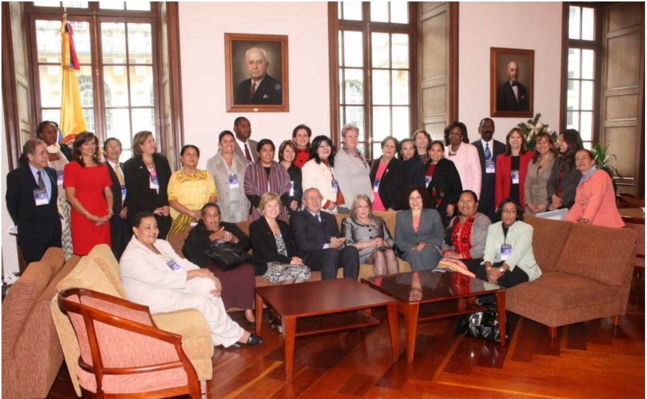
Participantes del Congreso “Hacia una Agenda Legislativa para el Desarrollo con Perspectiva de Género en las Américas”