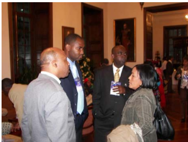
Diputados de Haití y de la República Dominicana, conversando.