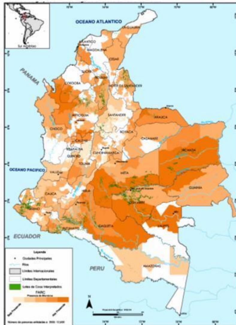
Mapa presencia grupos armados ilegales y cultivos de coca