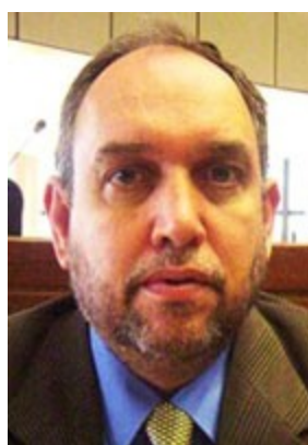
Alberto Grillón Conigliaro Senador Paraguay