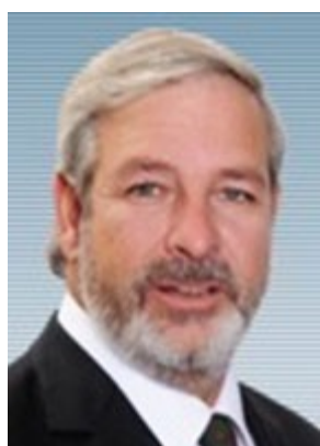
Ignacio Urrutia Bonilla Diputado Chile