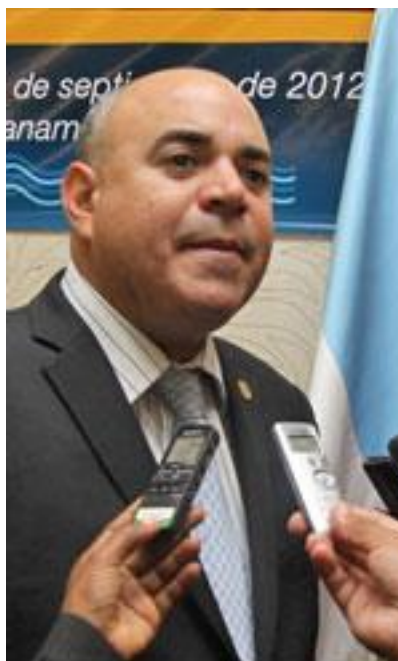
Victor Juliao III (Membre de l'Assemblée nationale, Panama) Hôte de l'Assemblée plénière 0