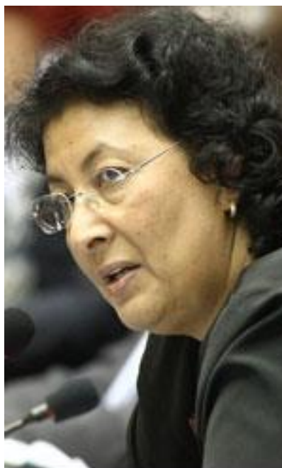
Jennifer Simons (Présidente de l'Assemblée nationale, Suriname) Hôte de la Rencontre 05