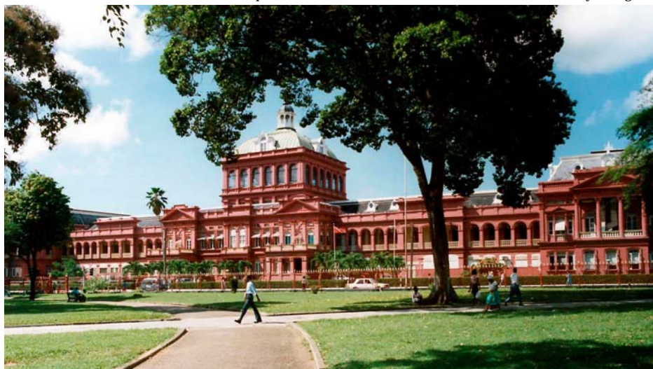
La "Casa Roja" es la sede del Parlamento de la República de Trinidad y Tobago.

Las propuestas para una nueva ley o para enmendar una existente pueden ser iniciadas en una u otra Cámara (excepto los proyectos de presupuesto que deben provenir de la Cámara de Representantes).