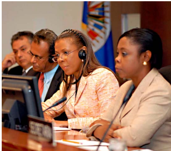
Deborah-Mae Lovell, de Antigua y Barbuda, preside el Consejo Permanente de la OEA.

En 1989, el Gobierno firmó y ratificó la Convención de las Naciones Unidas sobre la eliminación de todas las formas de discriminación contra la mujer (CEDAW por su sigla en inglés) y la Convención sobre derechos del niño en 1993. Ambas convenciones son reconocidas como instrumentos internacionales especializados en derechos humanos que dictan las normas para la protección de los derechos de mujeres y