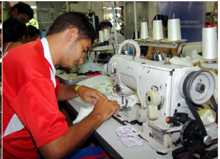
Las micro y pequeñas empresas son las que dan más trabajo. Por eso, la ley brasileña busca incorporarlas al mercado formal.

previstas por la Organización de las Naciones Unidas, el mismo compromiso asumido por los países miembros del FIPA.