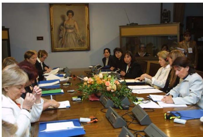
El cambio en la legislación permitirá el acceso de más mujeres a cargos directivos.

representatividad femenina en los consejos de dirección. El problema es determinar la mejor manera de crear cambios de actitud que arrojarán los resultados deseados. El cambio no ocurrirá sin presión.