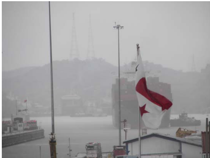
Con el Canal de Panamá como marco, la OEA alentó discusiones continentales.

Lo hicieron para fortalecer los lazos entre los Parlamentos americanos y la OEA, identificar nuevos mecanismos de colaboración que incluyan a los legisladores y buscar el otorgamiento de un status que permita al FIPA asistir a las reuniones de la OEA y de las Cumbres interamericanas en calidad de observador especial.