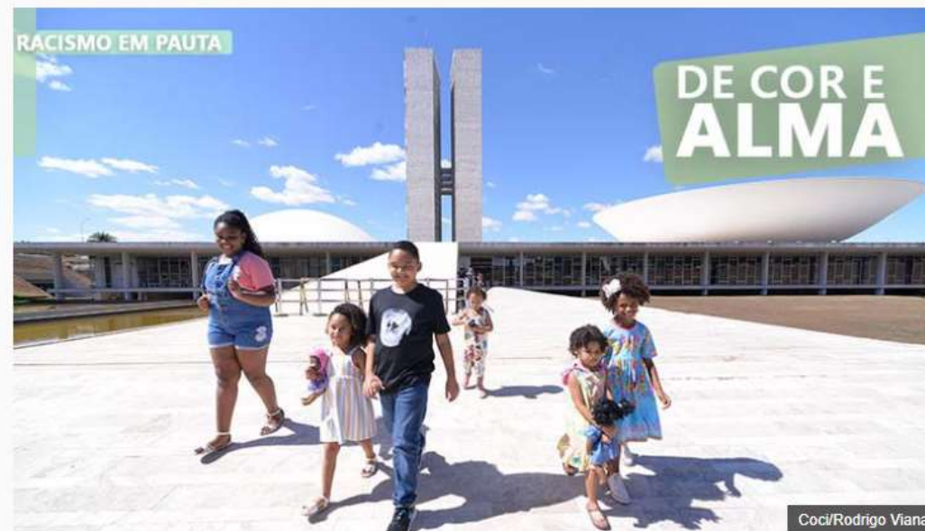
Crianças negras em visita ao Congresso Nacional depois do episódio de racismo

O racismo influenciou minha vida, mas o suporte que recebi me deixou mais forte