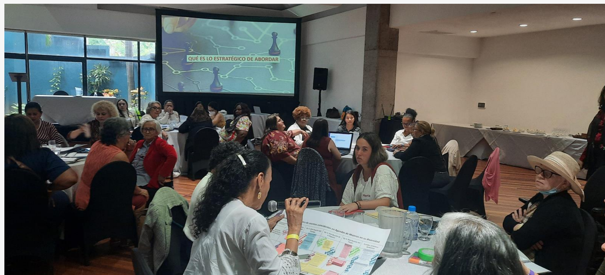
Colectivos representativos de mujeres en su diversidad (afrodescendientes - indígenas - mujeres con discapacidad - mujeres políticas)

Sistematización de la experiencia que permita rescatar los aprendizajes y propuestas de tal manera que pueda ser replicable la articulación de la estructura de género (INAMU-Mecanismos); su vinculación con otras instancias defensora de los derechos políticos de las mujeres y el impulso de espacios para el diálogo e inclusión de las demandas y necesidades de las mujeres diversas en las agendas de los partidos políticos de cara al proceso electoral..