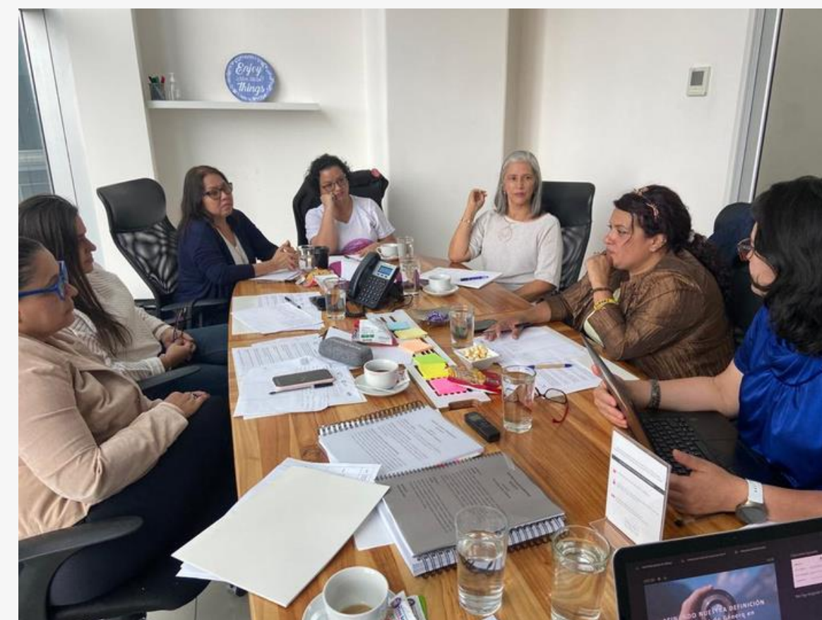
Frente de Mujeres de Partidos Políticos