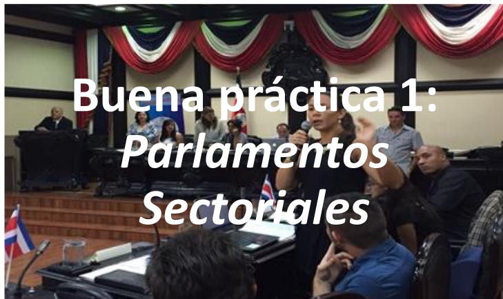
Buena práctica 1: Parlamentos Sectoriales