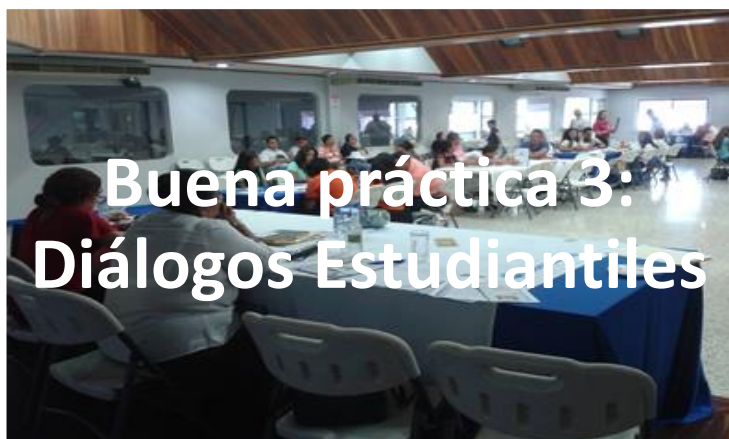
Buena práctica 3: Diálogos Estudiantiles