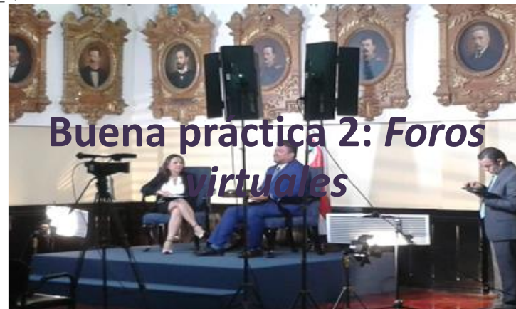
Buena práctica 2: Foros virtuales