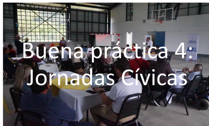
Buena práctica 4: Jornadas Cívicas