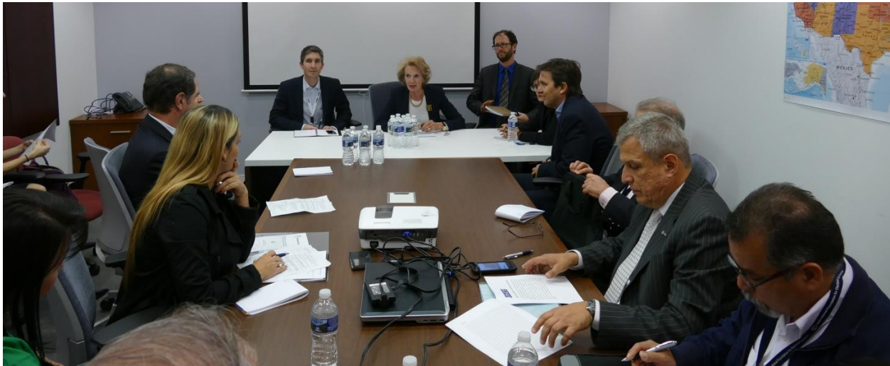
Reunión de la delegación de la visita parlamentaria con la Misión de Observación Electoral de la OSCE.