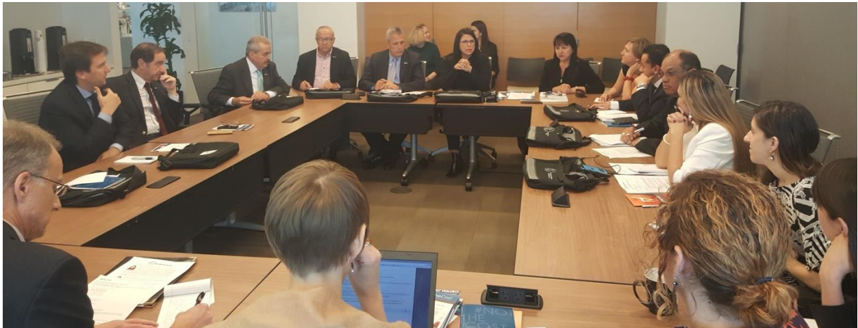
Reunión de la delegación de la visita parlamentaria con el Instituto Nacional Demócrata.