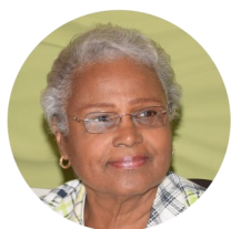
Exma. Dama Billie Miller , Embaixadora Extraordinária e Plenipotenciária de Barbados e Patrona do CIWiL

“Em todas as regiões há sempre mulheres que desafiam os obstáculos e as probabilidades. Quanto mais mulheres forem eleitas para o parlamento, mais mulheres serão eleitas para o parlamento. Cada mulher eleita aumenta a consciência e a confiança de outras mulheres [...] As mulheres são um investimento de alto retorno que gera grandes dividendos.”