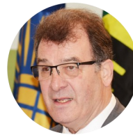
Exmo. Robert Nault , Deputado (Canadá) e Presidente do ParlAmericas

“Esta muito claro para mim e para outros que, para serem bem sucedidos, homens e mulheres devem trabalhar juntos para construir as sociedades inclusivas pelas quais lutamos. Precisamos defender a igualdade de direitos das mulheres como direitos humanos - a desigualdade de mulheres e meninas prejudica a todos nós, homens e meninos incluídos.”