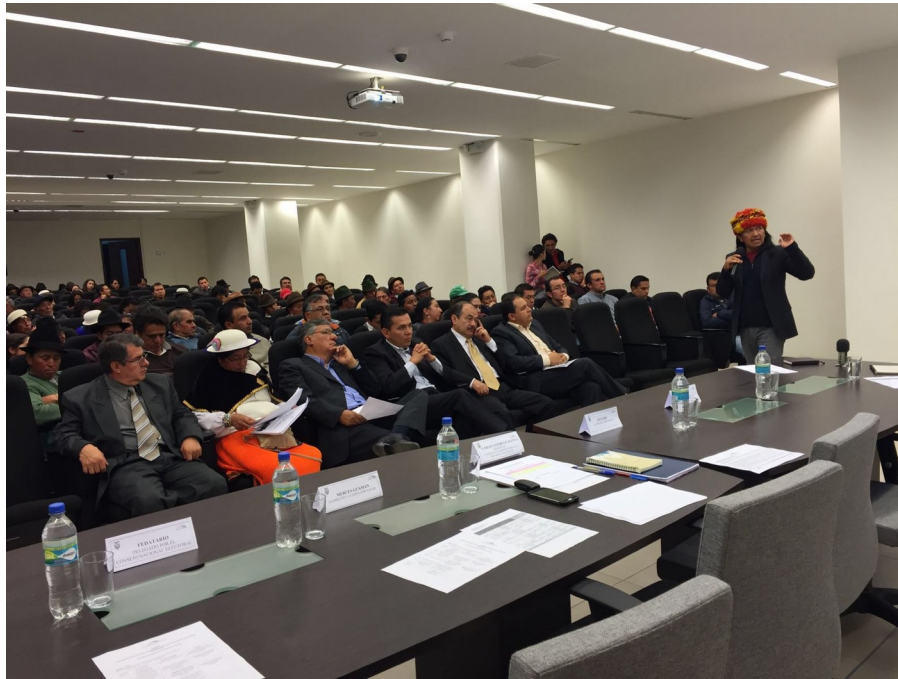
Provincia de Cotopaxi, 08 de marzo