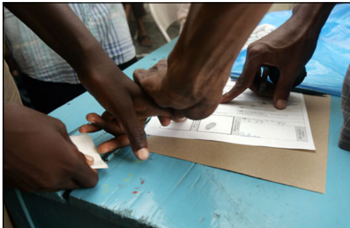
A través del voto, los haitianos renovaron su confianza en la democracia

necesario e imprescindible que la educación sea una prioridad para el desarrollo duradero”. Es por eso que “siempre hemos tenido un Estado centralizado, indiferente a las necesidades y los derechos fundamentales de los ciudadanos haitianos”.