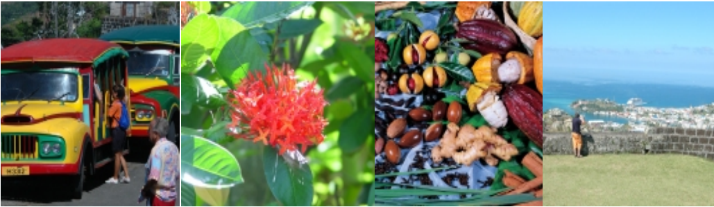
Escenas y paisajes de la vida cotidiana en Granada

Los objetivos de las políticas adoptadas por las autoridades de turismo de Granada reconocen que, para tener éxito, el turismo debe ser sostenible. Ese enfoque se refleja en tres declaraciones de política: