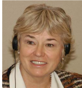
Senadora Hervieux-Payette, presidente

El Foro Interparlamentario de las Américas (FIPA) es una red independiente constituida por las legislaturas nacionales de los países miembros de la Organización de Estados Americanos (OEA). Mediante reuniones regulares e intercambios virtuales, los miembros del FIPA se han comprometido a entablar un diálogo interparlamentario sobre temas de interés común y a representar la voz de los parlamentarios en el proceso de integración hemisférico.